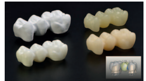
Subtractive processing of a bilayered CAD/CAM dental bridge construct

materials, like dental enamel, such effects take place through several length-scales through the hierarchical structural arrangement within the crystals and bulk. To grasp these mechanisms in LS2 dental ceramics in the macro-, micro-, and nano-scales, it is necessary to investigate specific material responses using state-of-the-art mechanical testing.