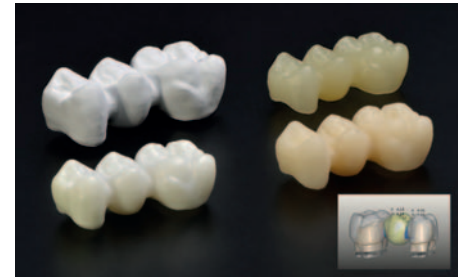
Subtraktive Prozessschritte einer zweischichtig CAD/CAM gefertigten Seitenzahnbrücke

rials zu steigern, werden Strategien untersucht, die Kristallite durch gezieltes Heißpressen anisotrop ausrichten, um damit gerade an den Schwachstellen, z. B. einer Brücke, die mechanische Stabilität zu verbessern.