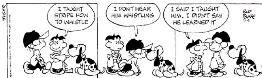
Abb. 1: Shift from teaching to learning (Blake, n.d.; zitiert nach Northern Illinois University, n.d.)

Die Tatsache, dass nicht die Wissensvermittlung durch die Dozierenden, sondern der Erwerb von Kompetenzen in der Lehre angestrebt wird, wird als „shift from teaching to learning“ bezeichnet. Dies wird durch die untenstehende Grafik veranschaulicht.