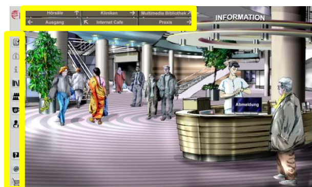
Abb. 3 Navigation und Funktionen

Die Anwender haben nach dem Login verschiedene Möglichkeiten zur Navigation (siehe gelbe Markierungen). Sie können (a) vom Dozenten hinterlegte Lernressourcen abrufen, wie z.B. PPT-Folien, Skripte, Handouts, Aufzeichnungen, Journal-Artikel usw.; (b) angelegte und freigeschaltete virtuelle Patientenfälle aufrufen und bearbeiten; (c) Hilfsfunktionen in Anspruch nehmen oder (d) mit anderen Nutzern die online sind oder mit dem betreuenden Dozenten in Kontakt treten und kommunizieren.