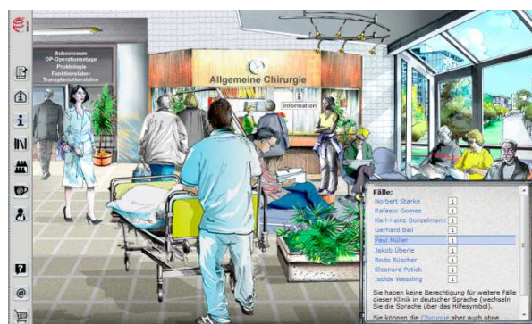
Abb. 6 Der Anwender wählt aus einer Liste an Patientenfällen einen Fall zur Bearbeitung aus.

In der jeweiligen Klinik des Fachbereiches, wählen die Anwender den gewünschten virtuellen Patienten aus und beginnen mit der Arbeit. Die Anzahl der auswählbaren Fälle ist davon abhängig, wie viele Fälle erstellt und hinterlegt wurden.