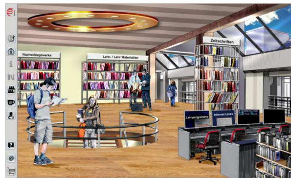
Abb. 5 In der Bibliothek werden ergänzende Informationsquellen hinterlegt (z.B. Links, Literaturverzeichnis, usw..)

In der Bibliothek können ergänzende Unterrichtsmaterialien und Informationen zu jedem einzelnen Fall hinterlegt werden. Je nach Bedarf, hat der Anwender hier auch Zugriff auf weiterführende, fallspezifische Links, Nachschlagewerke oder Zeitschriften.