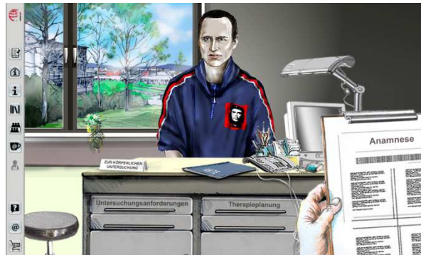
Abb. 7 Der Anwender untersucht den Patienten und nutzt Anamnesefragen, körperl. Untersuchungen, Laborwerte usw.

Im Patientenzimmer stehen den Anwendern fast alle Möglichkeiten der Patientenuntersuchung zur Verfügung. So erfolgt z.B. die Anamnese mit Hilfe eines Fragenkatalogs und fallspezifischen Antworten. Für die körperlichen Untersuchungen wählt der Arzt zw. verschiedenen körperlichen Positionen. Untersuchungsschritte und –werkzeuge werden dabei frei ausgewählt und eingesetzt. Die Anwender erhalten bei jedem Untersuchungsschritt ein direktes Feedback. In Bezug auf apparative Untersuchungen können Anforderungen gestellt werden (z.B. Labor, EKG usw.). Alle Befunde werden ad hoc präsentiert und können später in der Patientenakte nachgelesen werden.