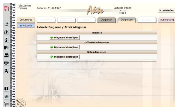
Abb. 7 Die Anwender dokumentieren Ihre Diagnosen und erstellen einen Therapieplan. Das System gibt Feedback.

Nach der Befundaufnahme, ist der Anwender aufgefordert, Diagnosen zu stellen. Hier gibt das System eine Rückmeldung, ob die Diagnose in diesem Fall eher richtig oder eher falsch war. Des Weiteren wird rückgemeldet, ob und wenn ja, welche Untersuchungen noch gefehlt haben. Auch kann der Anwender ein Feedback darüber erhalten, ob seine Untersuchungen unnötig waren und den Patienten nur unnötig belastet haben. Abschließend wird auch eine Rückmeldung gegeben, ob das Vorgehen zeitlich und finanziell ökonomisch war. Gleiches gilt für die Therapie.