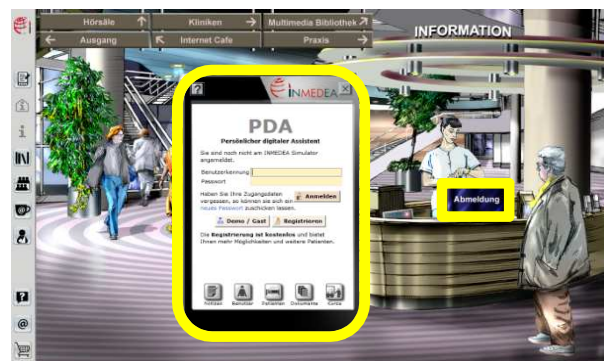
Abb2. Im Foyer loggen sich die Studierenden ein.

Die virtuellen Patienten stehen i.d.R. webbasiert zur Verfügung. Das Passwort zur Bearbeitung des Patientenfalles wird durch den Dozenten vergeben.